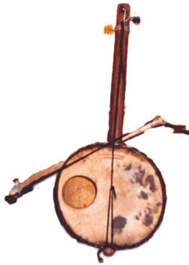
2 : violon monocorde