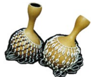
13 : hochets-sonailles