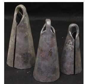
9 : Cloches