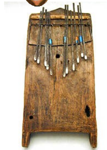
3 : Sanza