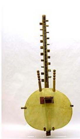
1 : Kora