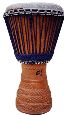
5 : Djembé