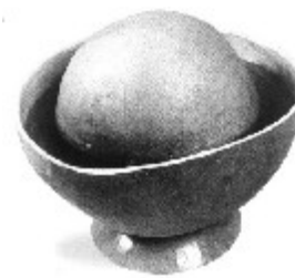
8 : Tambour d'eau