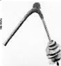
12 : Sistre