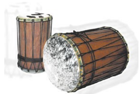
6 : Doum doum