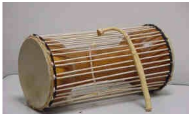
4 : Tama