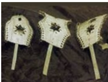
10 : Bruiteurs pour djembé